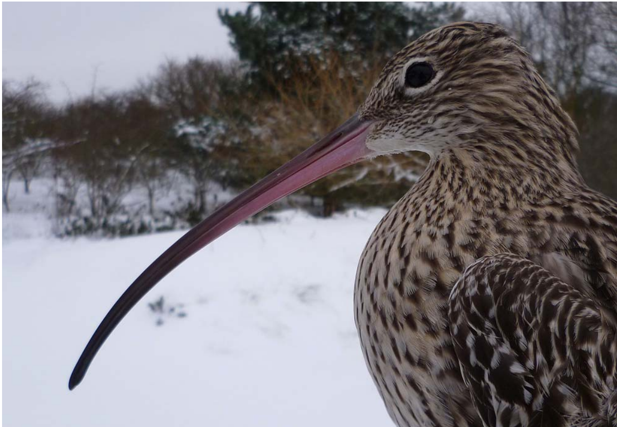
Afbeelding 26: Wulp, mannetje, waarschijnlijk eerstejaars, Meijndel, Wassenaar, 4 december 2010. Een nieuwe soort voor de ringbaan, waarvan in januari, augustus en december in totaal 5 exemplaren gevangen werden. Ringers: Vincent van der Spek, Maarten Verrips en Rinse van der Vliet.

Al in de tweede helft van november werd het koud in Nederland en vanaf eind november was het echt winters. Door sneeuwval was op diverse plaatsen in het land spectaculaire trek waar te nemen. Er werden bijvoorbeeld 102 Kraanvogels, diverse Blauwe Kiekendieven en een Ruigpootbuizerd waargenomen. Ook werden vrijwel dagelijks Houtsnippen en Roerdompen gezien. Desondanks leverden vangpogingen op 30 november en 2 december slechts vijf Watersnippen als noemenswaardige vangsten op. Het leek erop dat de trekdrang te sterk was, want overvliegende vogels maakten geen aanstalten om te landen. Pas op 4 december werd het goed, met de eerste Kievit ooit voor het VRS, een Wulp (en een tweede tot op de netrand) en de eerste 10 Stormmeeuwen van het jaar. Verrassend was dat de Kievit, een jonge vrouw, drie dagen later al werd teruggemeld uit Berkel en Rodenrijs (ZH), hemelsbreed 16 km ten zuidoosten van de ringbaan.