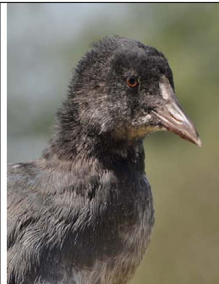
Afbeelding 9 Deze juveniele Meerkoet kon tijdens de CES worden gevangen. Meijndel, Wassenaar, 6 juli 2010. Ringers: Vincent van der Spek en Wouter Teunissen.

Met name bij de Kleine Karekiet wordt een aanzienlijk deel van de eerstejaars vogels geringd in de eerste decade van augustus. Ook hiervoor hebben we (sterke) aanwijzingen dat we dan (in ieder geval wat betreft een deel van de vangsten) niet meer te maken hebben met jongen uit de eigen broedvogelpopulatie, maar met jongen/vogels van elders (dispersie). Zo werd in deze periode een Kleine Karekiet gecontroleerd die in augustus 2004 als eerstejaars door ons geringd was. Deze vogel is in alle tussenliggende CES-seizoenen nimmer teruggezien en wellicht geen broedvogel ter plaatse. Ook zijn in deze periode door ons de afgelopen jaren meermaals juveniele karekieten met buitenlandse ringen en Sprinkhaanzangers met ringen van stations uit Noord-Holland gevangen.