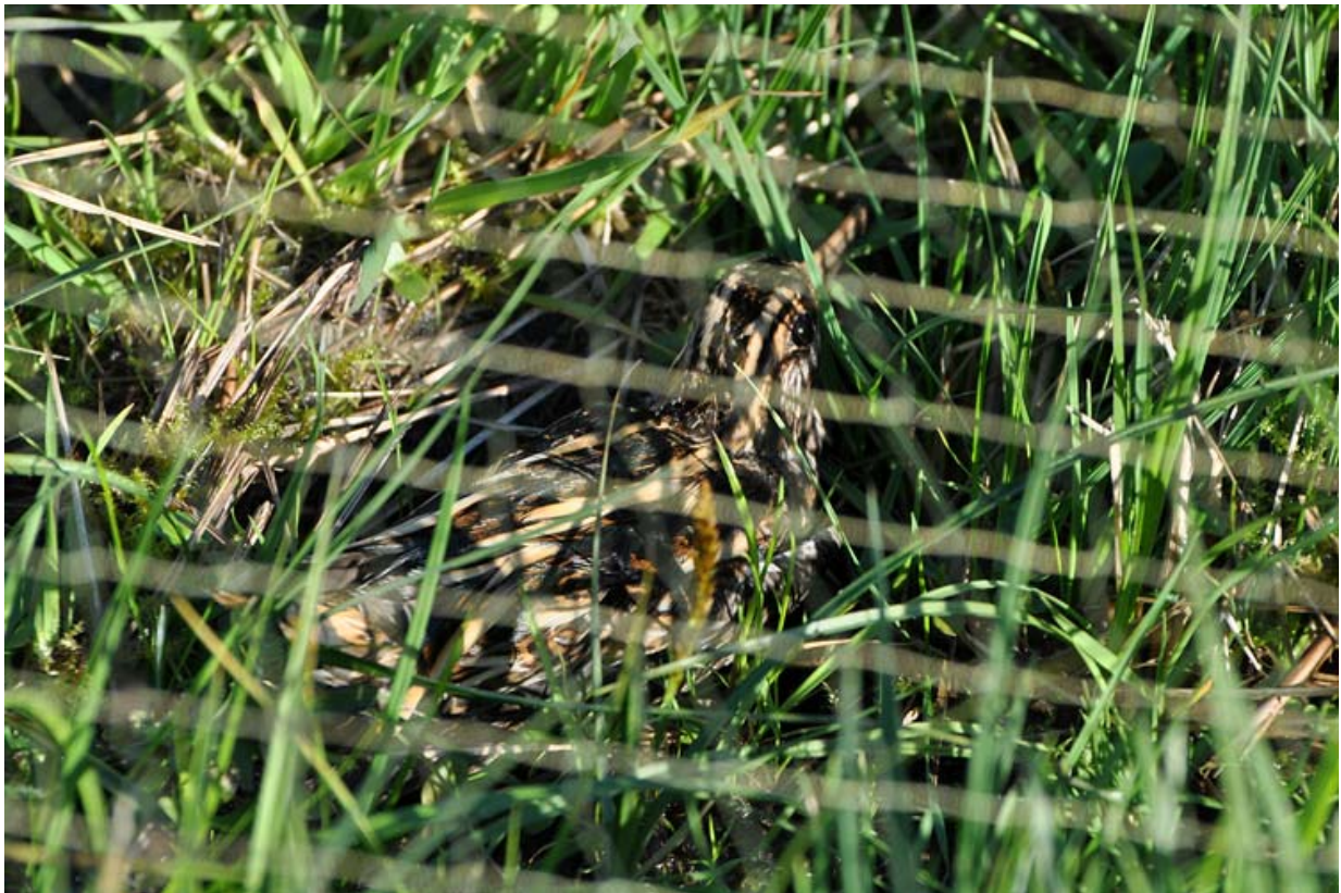
Afbeelding 29: Bokje onder het net, Duivenvoordse Polder, 17 oktober 2010