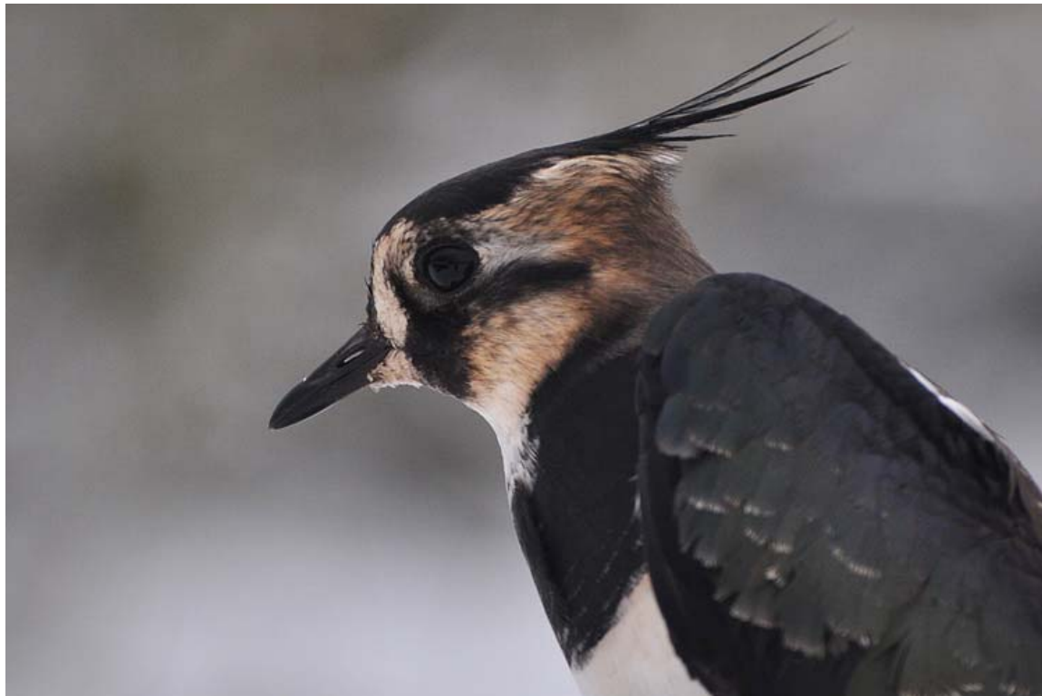
Afbeelding 32: Kievit, eerstejaars vrouwtje, Meijendel, Wassenaar, 4 december 2010 (© Vincent van der Spek). Eén van de nieuwe soorten voor VRS Meijendel die tijdens winterweer werd gevangen. De vogel werd drie dagen later 16 km verderop teruggemeld. Rings: Vincent van der Spek, Maarten Verrips en Rinse van der Vliet.