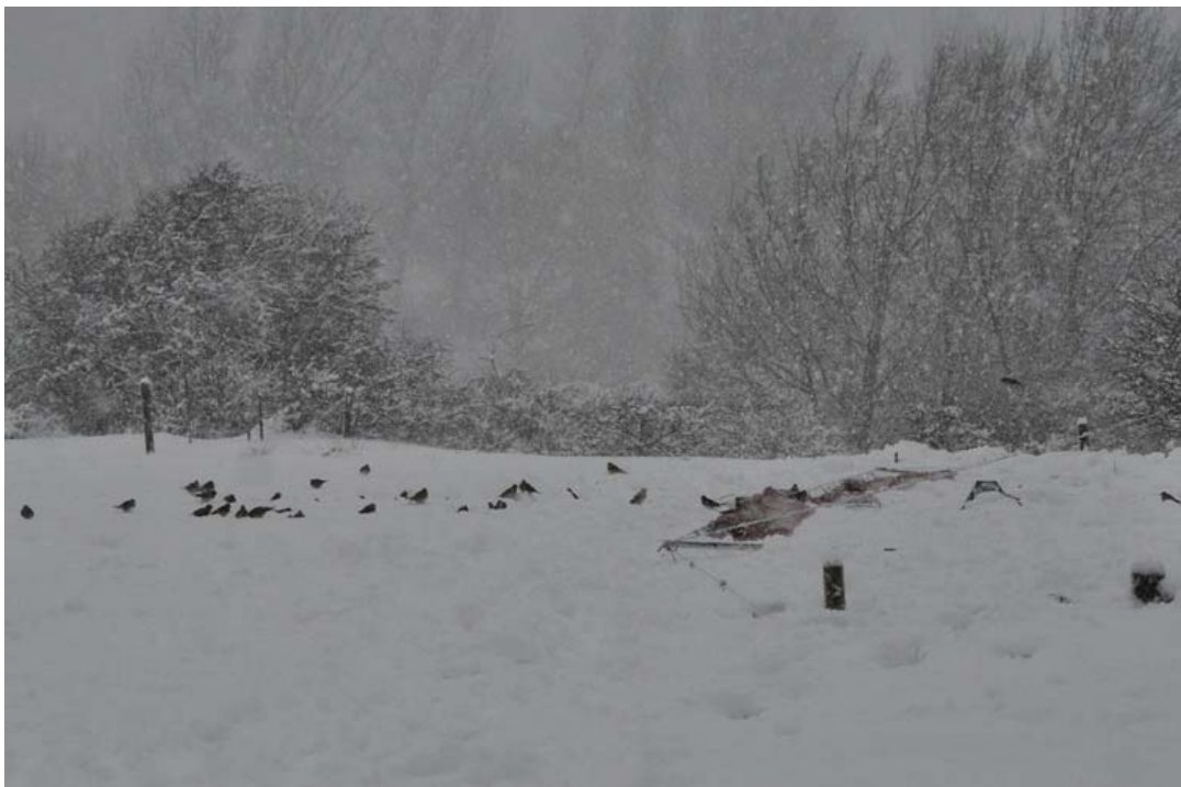
Afbeelding 4: Hevig winterweer: Veldleeuweriken naast en op het slagnet tijdens een sneeuwstorm, Meijndel, Wassenaar, 17 december 2010

Januari begon zoals 2009 eindigde: winters. Terwijl de rest van Nederland bedekt was met sneeuw, was de Haagse regio tijdenlang een spaarzame groene vlek op de satellietkaart van Nederland. Voor de sneeuw vluchtende vogels lieten zich in Meijndel dan ook lastiger vangen dan elders. In de middag van de 9 e kwam er verandering in het weerbeeld en werd ook hier het landschap wit, net als grote delen van de rest van Europa, tot aan Mallorca aan toe: een uitzonderlijke situatie. Van mei tot diep in augustus, overheerste een westelijke stroming: slechts zelden waaide de wind uit een andere hoek. Augustus was daarbij een behoorlijk natte maand. September was wisselvallig, met prachtig nazomerweer en oostelijke wind, maar ook met storm en regen. De eerste helft van oktober kende overwegend droog weer met (soms stevige) oostelijke winden; de tweede helft was het een stuk wisselvalliger. De eerste helft van november was wisselvallig. Vanaf het einde van de maand en in de eerste dagen van december viel er flink sneeuw: de winter viel vroeg in. Daarna was het tot half december in het westen van het land soms regenachtig met temperaturen boven nul, terwijl in het oosten van het land het kwik de nul graden nauwelijks passeerde en de wereld wit was. Tussen 17 en 21 december viel er extreem veel sneeuw: het land was aardig ontregeld, met honderden kilometers file, problemen bij de NS en een ontregeld Schiphol. Pas op Tweede Kerstdag viel de dooi in.