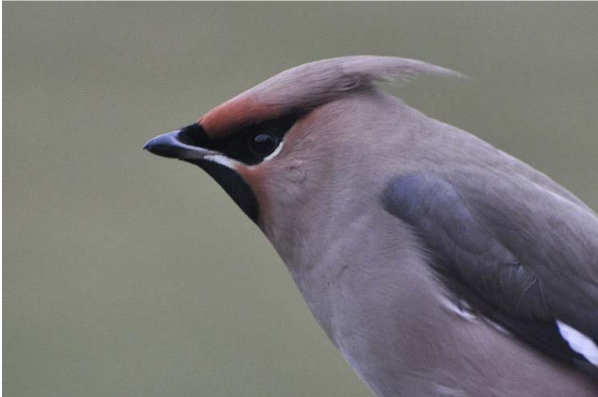
Afbeelding 22: Pestvogel, eerstejaars mannetje, 2 november 2010. Ringers: Vincent van der Spek, Wouter Teunissen en Rinse van der Vliet.

De eerstejaars man Noordse Goudvink die op 31 oktober werd geringd, was enorm: de vleugellengte bedroeg ruim 99 mm – 2 mm groter dan het aangegeven maximum in Svensson (1992) – en de vogel woog met een vetscore van nul liefst 30,5 gram. In Castricum (Levering & Keijl, 2008) is bijvoorbeeld nog nooit zo'n groot exemplaar geringd. Nederland kende een enorme invasie Pestvogels en er werden dan ook regelmatig exemplaren rond de baan gezien. In heel Nederland werden in 2009 22 exemplaren geringd, tegenover 166 in de 98 jaren daarvoor: kortom, echt een goed jaar dus. Een vangst kon haast niet uitblijven, en op 2 november was het dan ook raak: de tweede ooit voor de ringbaan, een jong mannetje. Een tweede exemplaar ontsnapte nog uit een mistnet. Dat werd kort daarna goedge maakt door de vangst van twee IJsvogels : daarmee werd 2010 met vijf nieuw geringde vogels en een terugvangst het beste jaar ooit. Na een opmerkelijke vangst van een Kleine Barmsijs op 31 juli (de eerste zomervangst ooit; daarnaast had de vogel een pigmentstoring) was er in het najaar een voorzichtige invasie van barsijsen. In totaal werden zes Kleine en 14 Grote Barmsijsen geringd, en bleven twee vogels ongedetermineerd. Het was prettig dat er in januari aardig wat lijsters waren geringd, want in het najaar viel het met de geringde aantallen niet mee.