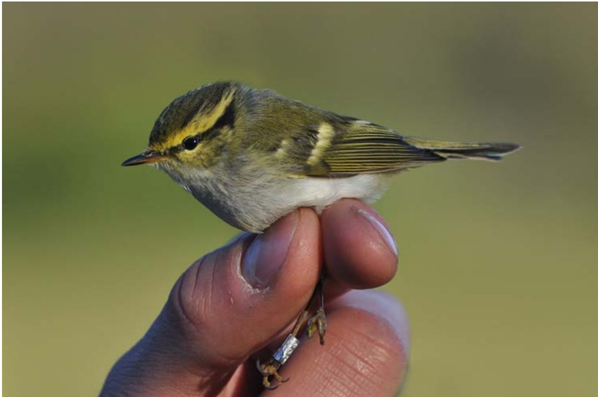
Afbeelding 5: Pallas' Boszanger, Meijndel, 17 oktober 2010: de eerste voor VRS Meijndel (© Vincent van der Spek). Ringers: Wijnand Bleumink, Vincent van der Spek, Wouter Teunissen, Maarten Verrips en Rinse van der Vliet.

In 2010 werden op 99 vangdagen 3.676 vogels geringd, verdeeld over 81 soorten en twee herkenbare 'extra' ondersoorten (Scandinavische Tjiftjaf en Noordse Goudvink). Daarnaast werden 417 geringde vogels gecontroleerd. In de Duivenvoordse Polder werden tijdens vier vangpogingen elf Bokjes geringd. Qua aantallen was dit het slechtste jaar sinds 2006, maar wat betreft het aantal soorten was 2010 het beste ooit. Het aantal niet-zangvogels was met 24 soorten hoog te noemen, al is het aandeel in het totaal aantal vangsten bescheiden (159 exemplaren). Niet eerder werden zoveel steltlopers en meeuwen gevangen als in 2010, zowel in soorten als in aantal exemplaren. Veruit de meeste vogels die in Meijndel gevangen worden, zijn echter zangvogels. Diverse soorten lieten het dit jaar aardig afweten: het was een bar slecht jaar voor de 'bulksoorten' Graspieper, Nachtegaal en Zwartkop en dat had zijn weerslag op het eindresultaat. Voor het eerst sinds 2003 werd geen enkele uil geringd en ook Porseleinhoen, Buizerd, Oeverpieper en Baardmannetje ontbraken dit jaar op de lijst. Daar staat tegenover dat elf soorten qua aantallen een jaarrecord boekten en dat, gerekend vanaf 2000, tien nieuwe soorten voor de ringbaan bijgeschreven werden: al met al een wisselvalig jaar waarin toch genoeg te beleven viel.