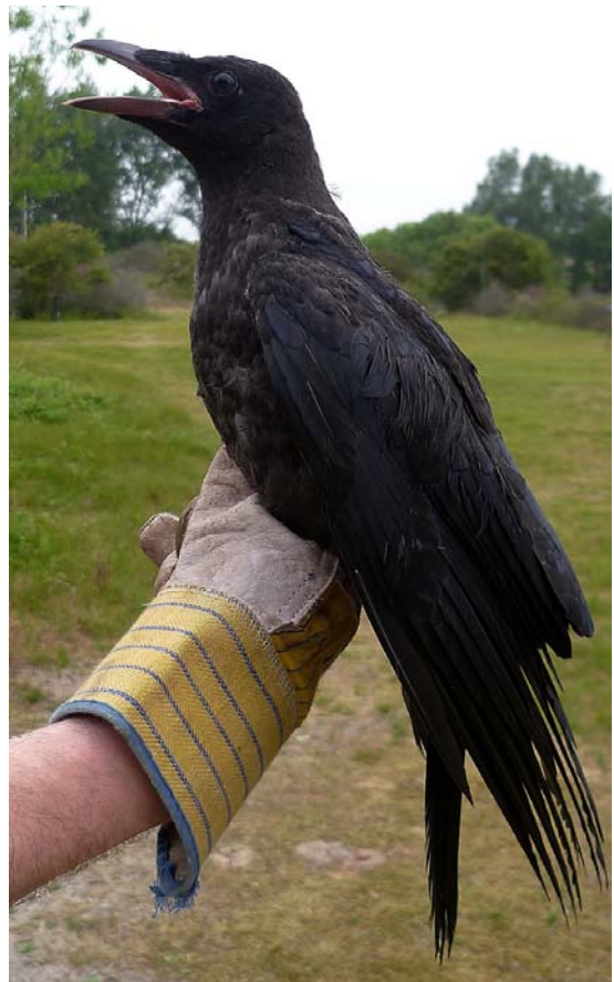
Afbeelding 6: Eindelijk gelukt! Zwarte Kraai, juveniel, Meijndel, Wassenaar, 30 juni 2010. Ringers: Maarten Verrips en Rinse van der Vliet.

In totaal zijn in Meijndel sinds 2000, excl. ondersoorten, escapes en exoten, 120 soorten geringd.