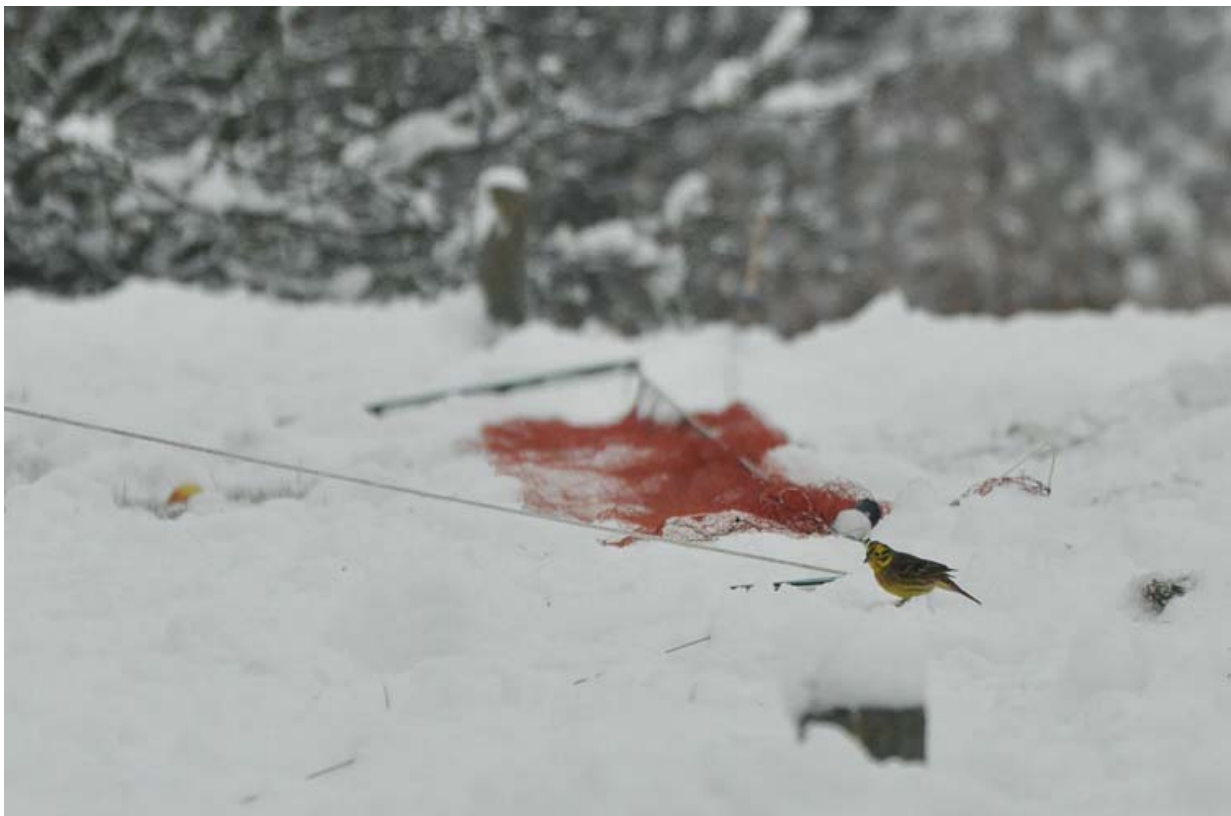
Afbeelding 28: Mannetje Geelgors naast het slagnet, Meijendel, 21 december 2010. De vangst van deze vogel betekende de laatste nieuwe baansort in 2010. Ringers: Vincent van der Spek en Rinse van der Vliet.

Al met al kende het matige 2010 in december dus een uitstekende uitsmijter.