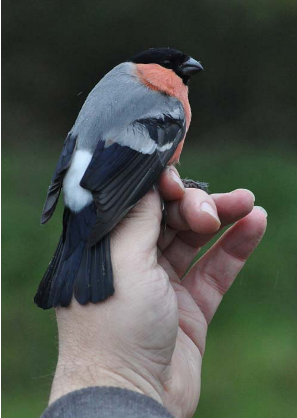
Afbeelding 1: Noordse Goudvink, eerstejaars mannetje, Meijendel, 31 oktober 2010. De vogel had een vleugel van ruim 99 mm en woog, met vetgraad nul, liefst 30,5 gram. Ringers: Kasper Hendriks, Vincent van der Spek en Wouter Teunissen.