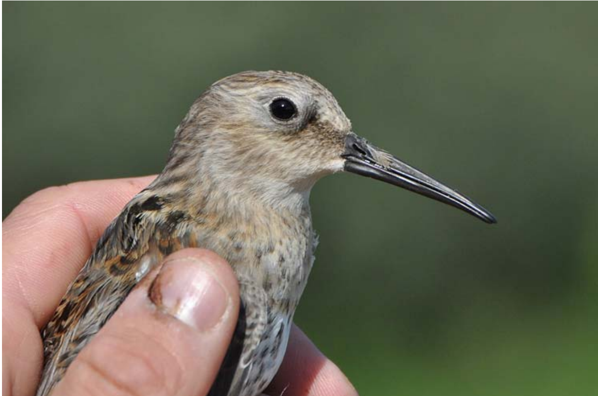
Afbeelding 17 Bonte Strandloper, juveniel, Meijndel, 5 september 2010: de eerste voor VRS Meijndel (© Vincent van der Spek). Ringers: Kasper Hendriks, Vincent van der Spek, en Rinse van der Vliet.

Op de laatste dag van augustus en de eerste dagen van september was het eindelijk zonnig weer met wind uit de oostelijke hoek. In het land waren influxen gaande van (noord)oostelijke soorten, zoals Zwarte Ooievaar, Grauwe Franjepoot, Draaihals en Sperwergrasmus. Op 31 augustus werd een Sperwergrasmus gevangen. Tevens werd met 12 exemplaren een dagrecord Heggenmussen gevestigd, met daarbij een terugvangst van een vogel die door onszelf was geringd op 2 juli 2005. Met 115 vangsten was dit pas de eerste dag van het jaar met meer dan 100 exemplaren. Ook 3 september was een uitstekende dag met wederom 115 vangsten van 21 soorten, met daarbij een Draaihals , de tweede Snor en tweede Boomklever ooit en een Kleine Karekiet met een Zweedse ring.