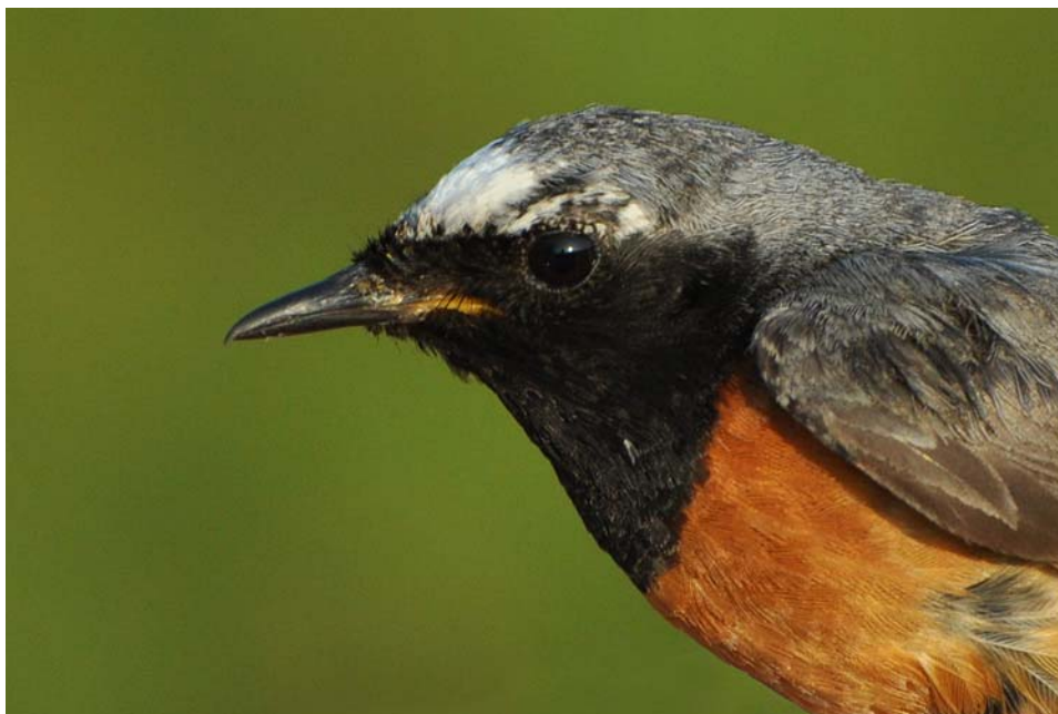
Afbeelding 31: Gekraagde Roodstaart, adult mannetje, Meijendel, Wassenaar, 26 juni 2010. Deze vogel is minimaal vijf jaar oud. Ringers: Wijnand Bleumink, Vincent van der Spek en Maarten Verrips.