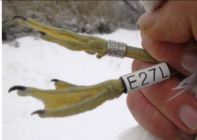
Afbeelding 27: Stormmeeuw met de eerste kleurring voor het ringstation, 25 december 2010

december dreigde 2010, met slechts één vangst, nog het slechtste jaar ooit te worden. Op 23 december werden echter twee exemplaren verleid om voer van het slagnet te halen, en op 25 december zelfs drie: een dagrecord. Onder deze vogels bevond zich een exemplaar dat door ons op 24 juni 2005 als eerstejaars geringd was: vijf-en-een-half jaar eerder dus! Op de 29 e tenslotte werd ook nog een vogel teruggevangen uit december 2008.