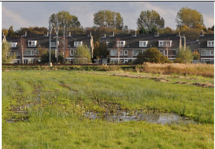
Afbeelding 30: Terrein voor Bokjes, Duivenvoordse Polder, 30 oktober 2010

Dit was het tweede jaar van winter-RAS Bokjes (Retrapping Adults for Survival) in de door Staatsbosbeheer beheerde Duivenvoordse Polder. Het doel is onder andere om plaatstrouw te meten en om de aanwezigheid van Bokjes te koppelen aan terrein- en weersomstandigheden. Het project vindt plaatst in samenwerking met Adri Remeus, de vogelteller van de polder. Tussen oktober en maart wordt minimaal eens per maand geringd. Daarnaast wordt in deze periode eens per decade geteld.