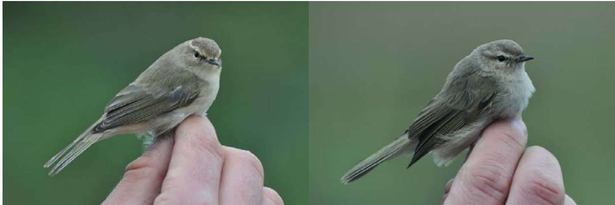
Afbeelding 23 & 24: Vermeende Scandinavische Tijftjaffen in Meijndel op resp. 7 en 9 november 2010. Deze koudgrijs ogende vogels hebben nauwelijks geeltinten (de linker nog iets in de wenkbrauw) en vrijwel geen groen op de mantel. De wangen zijn licht en de snavel en poten overwegend zwart. Beide vogels hebben een aanzet tot een vleugelstreep. Ringers: Vincent van der Spek en Rinse van der Vliet.