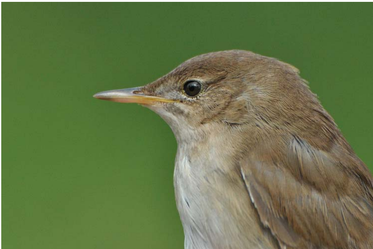
Afbeelding 3: Snor, eerstejaars. Meijndel, Wassenaar, 3 september 2010. Ringers: Vincent van der Spek en Rinse van der Vliet.

De in 2008 gemaakte afspraken met Dunea en de Vogelwerkgroep Meijndel met betrekking tot vangperiodes, gebruik van geluid en het bijtijds aanmelden van nachtvangsten zijn medio 2010 geëvalueerd. Tijdens de gesprekken werd geconcludeerd dat de samenwerking tussen de drie partijen goed is, er regelmatig contact is en dat de gemaakte afspraken worden nageleefd. Tijdens de evaluatie is besproken de ringactiviteiten te verruimen in perioden dat de vogelwerkgroep hier geen hinder van ondervindt tijdens inventarisaties. De hernieuwde afspraken zijn te vinden in bijlage 1.