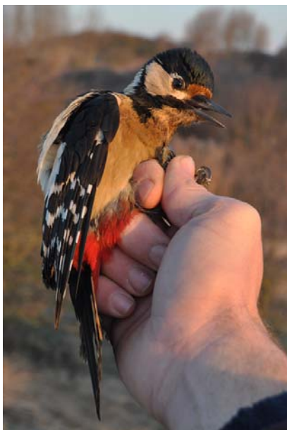
Afbeelding 7: Grote Bonte Specht, vrouwtje tweede kalenderjaar, Meijndel, Wassenaar, 3 januari 2010.

Deze vogel heeft een pigmentstoring: de "koffie-met-melk-kleur" is geen vuil. De bruinige kleur was aanwezig op de normaalgesproken witte delen van het voorhoofd, de kin, de keel, de borst, de buik, de flanken, de buitenste staartpennen en in wat mindere mate op de wangen. De vogel werd op de 17 e van de maand nog teruggevangen.